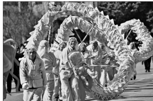
1月30日,在贵州省黄平县新州镇,舞龙队在表演舞龙。元宵节临近,各地举行特色民俗展演及灯光秀、做元宵等活动,喜迎元宵佳节。