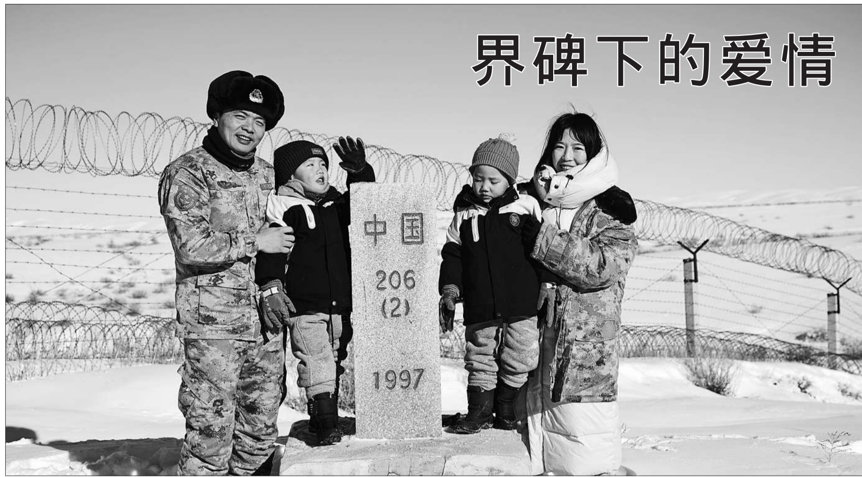
□ 聂宏杰 任朝阳 李 峰 文并摄

熙熙攘攘的春运人潮中，黄睿浙带着两个孩子和一大堆行李左冲右突。样貌、着装一模一样的双胞胎儿子吸引了很多人的目光。