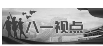
□ 许家铭 王梓嘉 胡 森 中青报 中青网记者 郑天然

寒风呼啸，身着白色伪装装的武警特战队员脚踩滑雪板穿行于林海雪原间，在运动中瞄准、击发、命中目标。