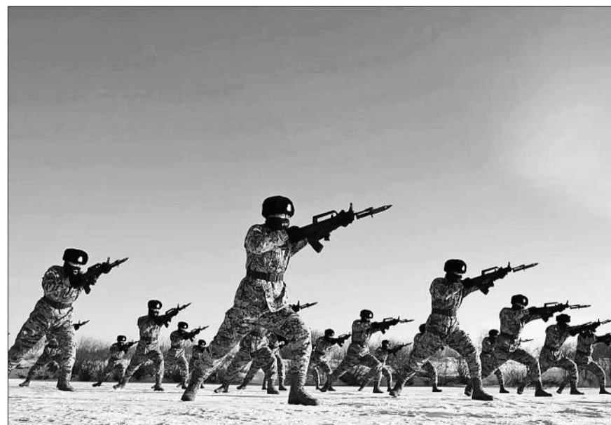
近日，武警黑龙江总队黑河支队在极寒条件下开展冬季大练兵。图为官兵正在进行刺杀训练。

连日来，位于祖国边陲的黑龙江黑河最低气温已突破零下40摄氏度。面对极寒，驻守在这里的武警黑龙江总队黑河支队官兵叫响越是严寒越向前的口号，在白山黑水间掀起了冬季大练兵的热潮。