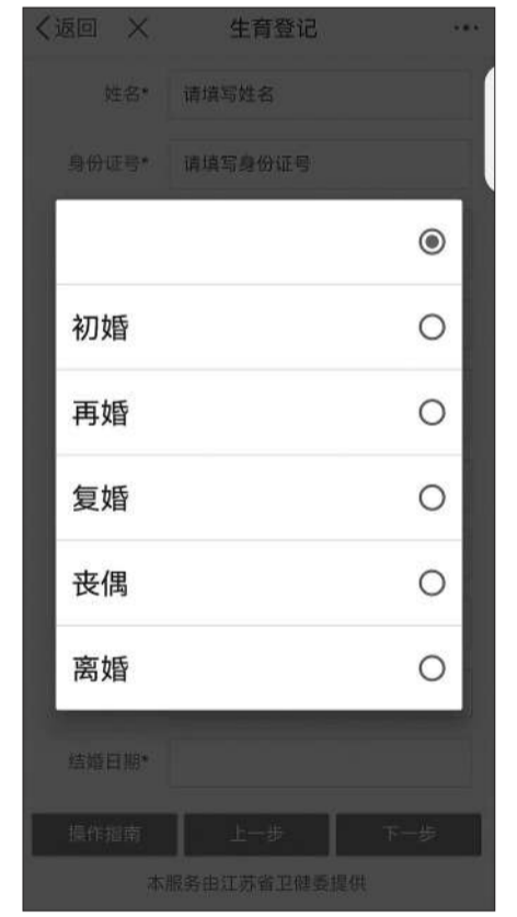
2023年2月,江苏省苏服办App,可以进行生育登记的几种情形。