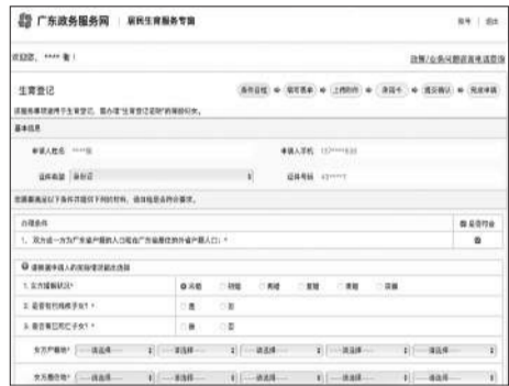
2023年2月,广东政务服务网,未婚列入可以进行生育登记的情形。

为何这项纯粹的管理生育人口的工作成了非婚妈妈们享受生育相关权益时的拦路虎呢?北京两高律师事务所律师、婚姻家事法律专家张荆介绍,生育登记制度是由此前的准生证(计划生育服务证)制度演变而来的。此前,在一