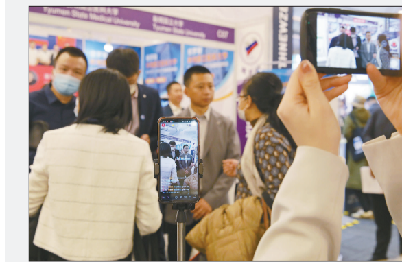
2月17日,北京国际会议中心,第23届中国国际教育展现场的手机直播。2月17日至18日,第23届中国国际教育展在这里举行。据介绍,中国国际教育展由中国教育国际交流协会主办,已连续举办20余年。本届展会共有来自包括澳大利亚、白俄罗斯、加拿大、德国、西班牙等20多个国家和地区的近200所院校参展。据介绍,展会以线上线下方式同步举办,继续提供国际教育优质资源平台,满足青年学子线上出国留学、相关院校合作办学的需求。展会现场,各院校展台前大批学生和排队咨询留学事宜,受疫情影响曾一度沉寂的留学市场渐渐恢复热度。