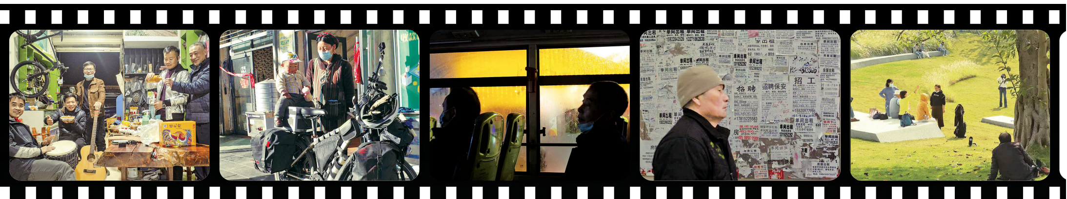
在旅途中,江畅拍下跟自行车店老板一起吃饭、带着孩子的藏族妈妈、夜晚公交车上的乘客、路过告示栏的老人、在公园里春游的游客等形形色色路人的留影。