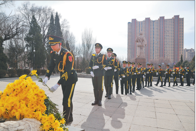
3月1日上午，辽宁省抚顺市雷锋纪念馆，接待为雷锋献花的现场官兵。当日，中央军委政治工作部、共青团中央组织军地青年典型代表，在抚顺市举行祭扫雷锋墓活动。20名军地青年典型代表、200名驻抚顺部队官兵代表、抚顺各界青年代表参加。

中国经济高质量发展，这些新科技也是今年全国两会代表委员们关注的热点。2023年世界移动通信大会最近在西班牙巴塞罗那举行，全国政协委员、中国移动董事长杨杰以“数智人”方式远程出席大会并作主旨演讲。由中国移动综合运用人脸建模、表情迁移、语音合成等技术打造的“数智人”，能够仿真人类的外貌、行为。 (下转2版) 扫一扫看视频