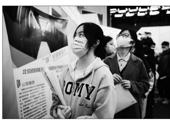
3月1日，在北京信息科技大学，求职学生在招聘会内求职。

本报讯(中青报 中青网记者李超)日前，江苏省学生联合会第十一次代表大会在南京开幕。江苏省委副书记邓修明出席会议并讲话，省政府副省长徐缨、省政协副主席胡刚参加开幕式。