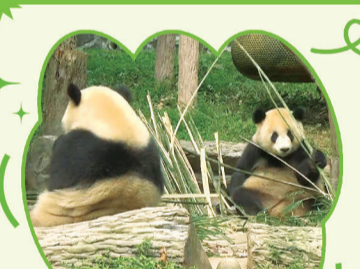
盟盟：明明什么都没干，它怎么就能睡那么久？