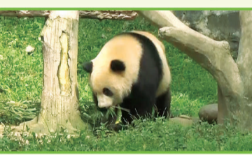
嘟嘟：我只是大自然的搬运工。