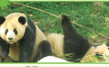
盟盟：让我为你按个太阳！盟盟：？