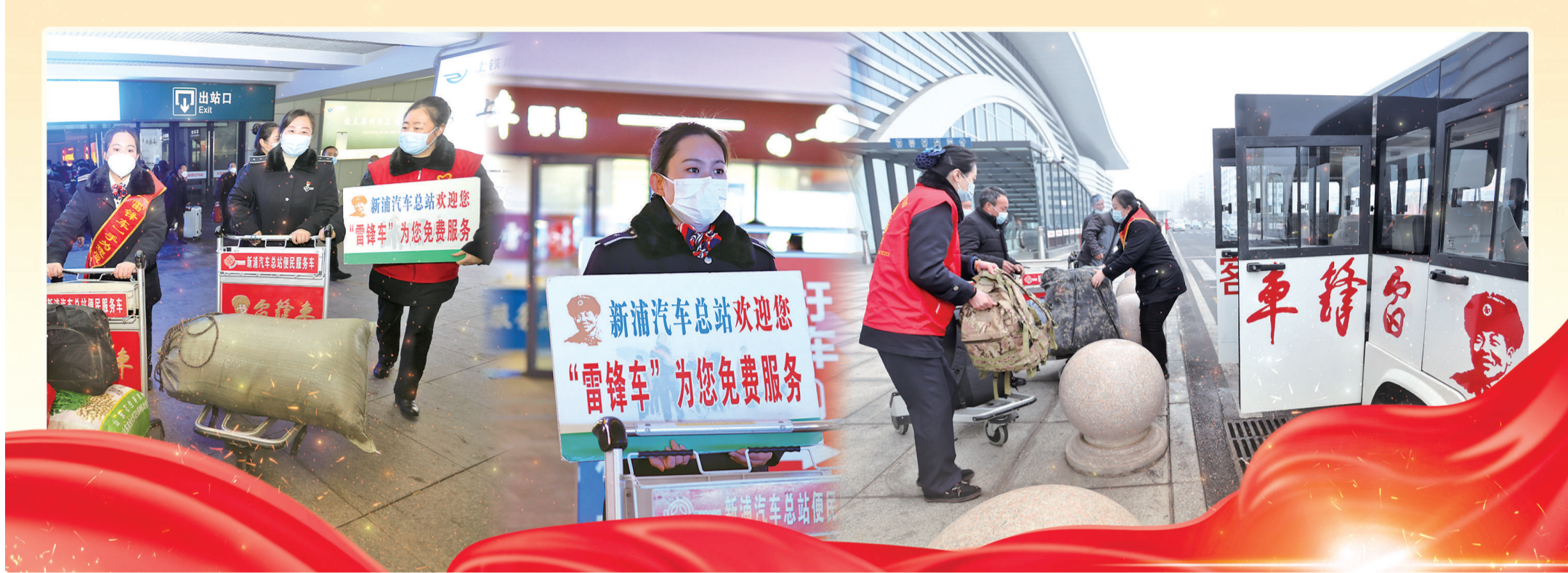
江苏省连云港市新浦汽车总站新一代“雷锋车”手驻守岗位。