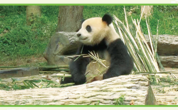
嘟嘟：今天的角色扮演的作业——刻录。