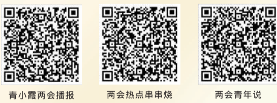
青小霞两会播报 两会热点串烧 两会青年说