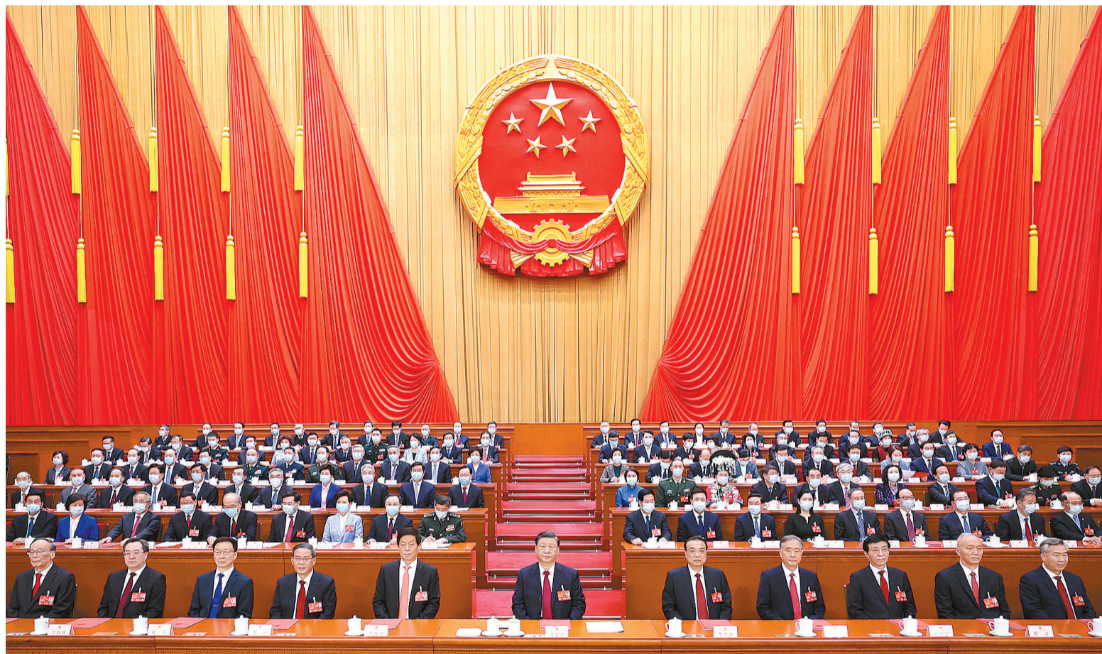
3月13日,第十四届全国人民代表大会第一次会议在北京人民大会堂闭幕。中共中央总书记、国家主席、中央军委主席习近平发表重要讲话。