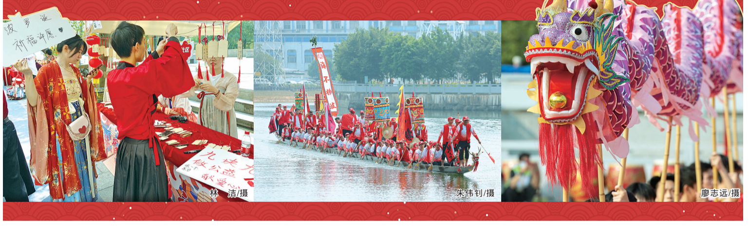
逛扶胥古镇市集 打卡 扶胥号 新龙船 看舞龙表演 感受 波罗诞 千年庙会的非凡魅力。

喝彩声此起彼伏，锣鼓声连绵不绝。扶胥号龙船朝王正在广州南海神庙古港码头进行巡游。阔别3年，千年庙会波罗诞于日前重启。 龙船朝王是黄埔龙舟文化里最具特色的一个习俗。每年端午节前，黄埔各村寨都会把本村的龙船都划到南海神庙，将龙头、龙尾及船上的装饰都卸下来，抬到南海神庙里敬奉。为迎接波罗诞，今年特地将这项民俗活动提前举办。 在人潮人海中，不少年轻人穿上汉服，加入了祈福游的队伍，专程打卡扶胥号新龙船。他们觉得，穿越千年再现祭海祈福，这种沉浸式的体验太有意思了。