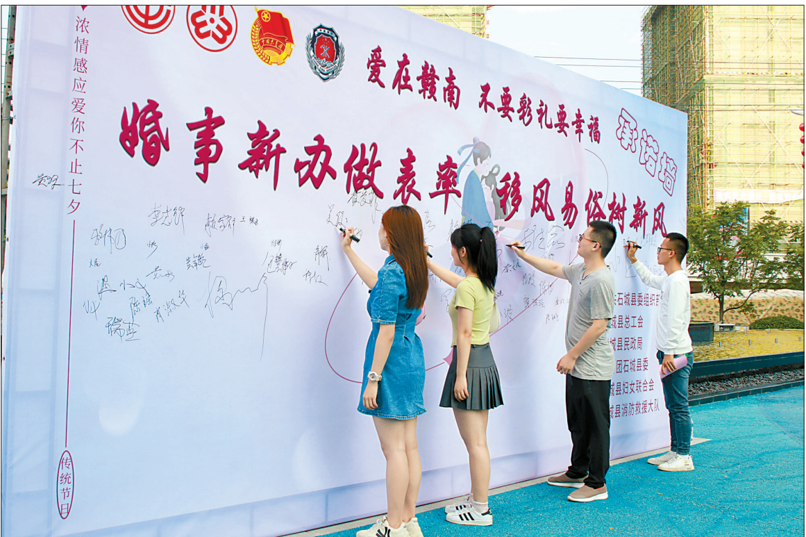
江西省上饶市单身青年联谊活动现场。

新余市渝水区的婚姻登记处已经成为婚姻家庭教育宣传阵地。线下，从思想源头传递移风易俗的理念。每周两天，在区婚姻登记处及市图书馆开展婚姻家庭公益咨询，为市民答疑