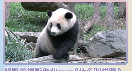
联盟的摄影作业——《什么叫优雅》。