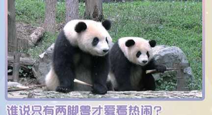
谁说只有两脚兽才爱看热闹？