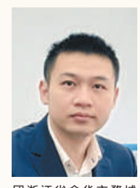
团金华市婺城区委书记 单华杰

团滦平县委以服务青少年成长成才为主线，积极实施青春建功行动，从各领域夯实基层服务阵地。突出实践育人特色，打造10个少先队校外实践教育基地，常态化开展沉浸式、体验式主题教育实践活动，深化希望工程品牌，实施圆梦微心愿、圆梦助学、心理健康咨询等活动，对困境青少年进行点对点帮扶，成立乡村振兴服务联盟，组织金团助青活动，为青年创业者争取6亿元信贷支持。团滦平县委以团中央童心港湾试点项目为抓手，优化整合各类资源，规范运行管理制度，持续开展亲情陪伴、情感关怀、励志教育等相关留守儿童服务。团滦平县委将继续发挥共青团的组织优势，创新团教协作机制，加强少先队社会化建设，提升实践育人效果，用好青年之家、青年社团、网上共青团等服务阵地，有效发现和解决青少年诉求，加强青年发展友好型城市建设，落实10个领域暖心政策，持续激励青年创新创业、岗位建功，努力在构建中国式现代化承德场景、滦平场景中贡献青春力量。