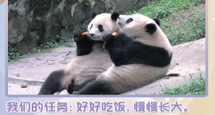
我们的任务：好好吃饭，慢慢长大。