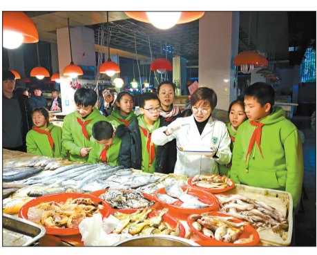
参加垦荒精神实践营的孩子们跟着市场监管员一起，在生鲜区采集鱼样本，再带去检查是否新鲜。