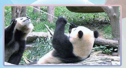
金嘟嘟“钓鱼(姐)”——一钓一个准。