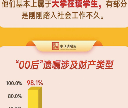
（数据来源：中华遗嘱库）