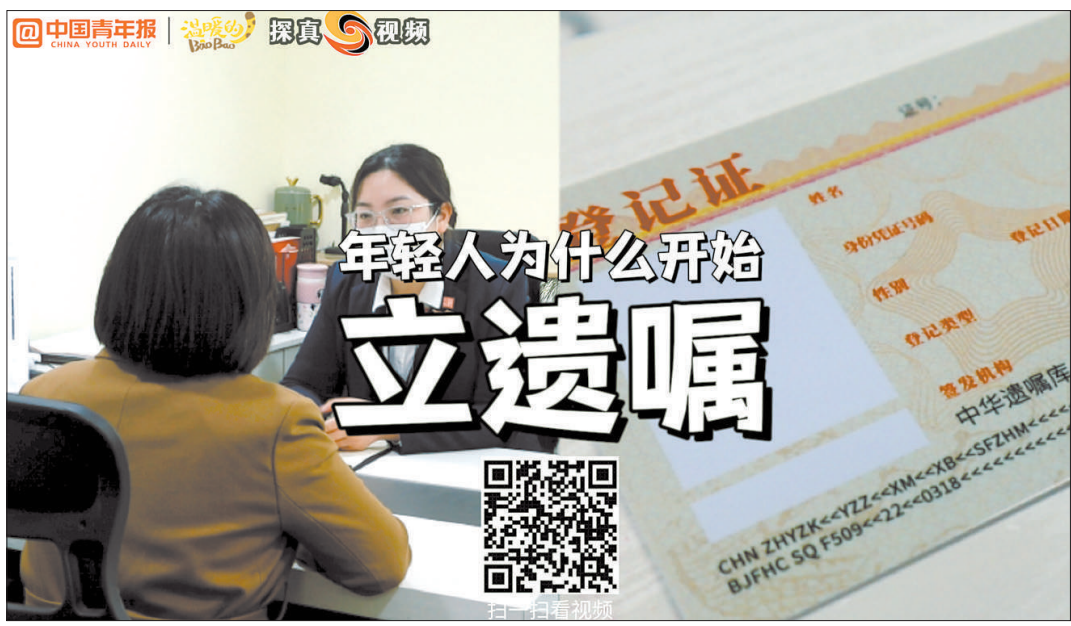
中青报 中青网记者 先藕洁/摄 制图/刘胤衡

与之前年轻人对生前预嘱表现出积极态度，而前来咨询的高龄老人相对很少这一情况不同的是，立法实施后，老年人和肿瘤患者的咨询数量和订立数量比例已经较前明显增多。