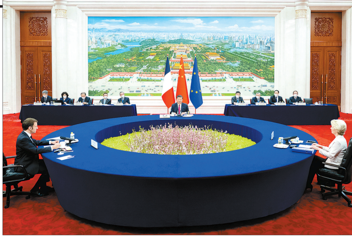
4月6日下午，国家主席习近平在北京人民大会堂同法国总统马克龙、欧盟委员会主席冯德莱恩举行中法欧三方会晤。