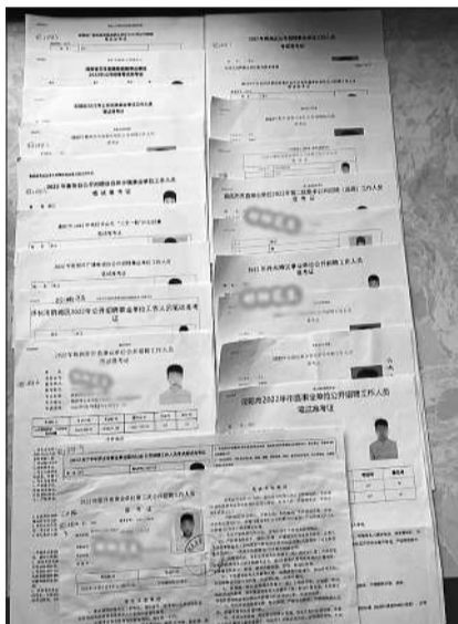
吴江参加考试的准考证。