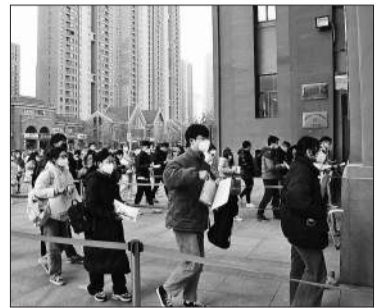
1月8日,安徽合肥,中央机关及其直属机构2023年度考试录用公务员公共科目笔试举行,合肥一考点考生准备入场参加公共科目笔试。新华社发 陈三虎/摄

有些人靠着巡考上了岸,有些人还在努力游向岸边。不管上岸没上岸,走好脚下的路,才能找到通往未来的答案。白叶说。(注:菲比、白叶、阿巍、小春为网名)