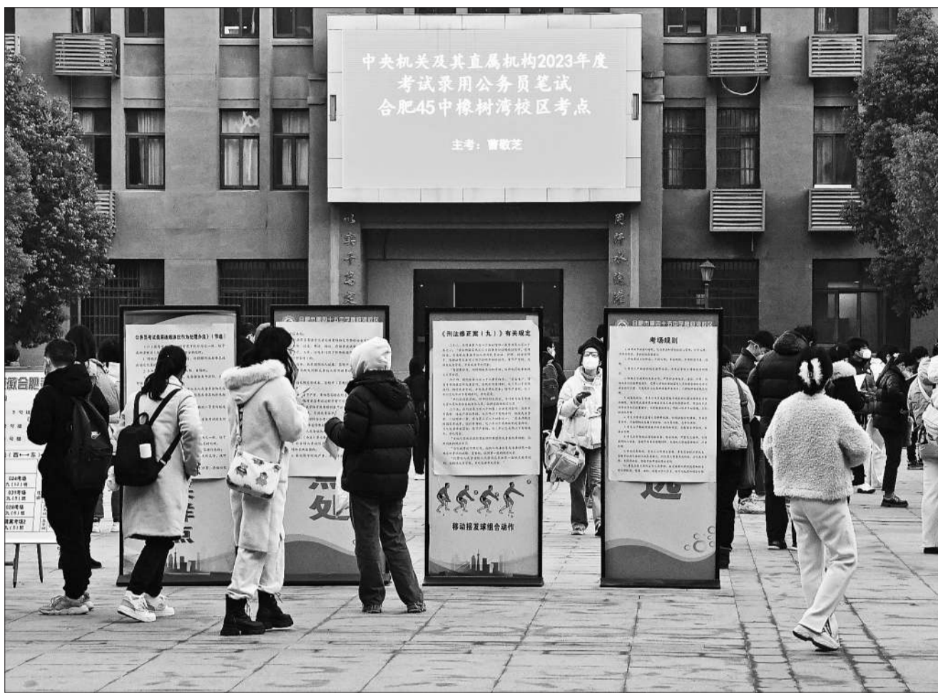
1月8日,安徽合肥,中央机关及其直属机构2023年度考试录用公务员公共科目笔试举行。