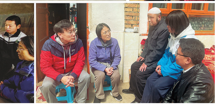
2023年4月初，兴华助学团队到受助学校、受助学生家中走访。