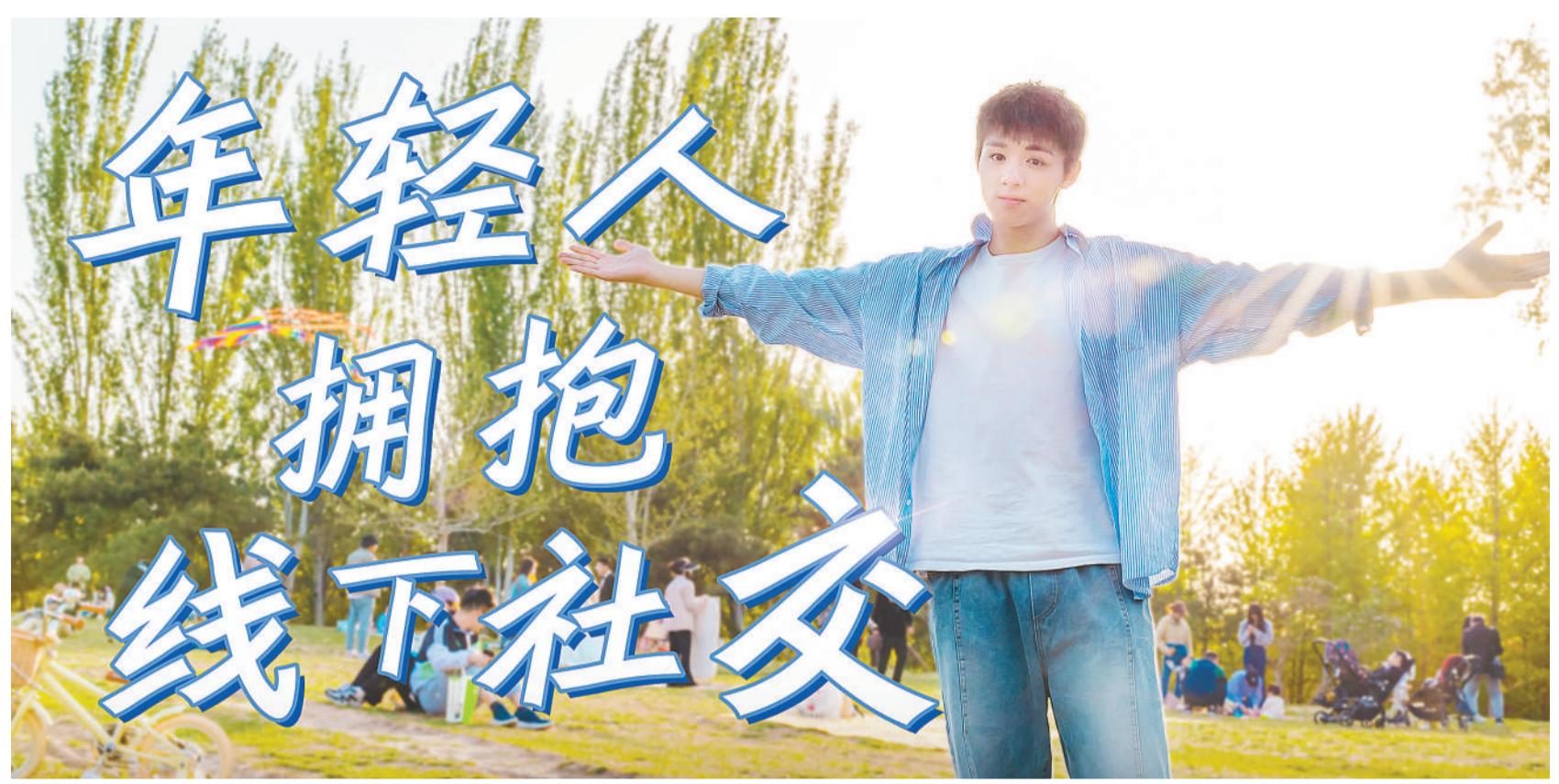
制图:林天羽