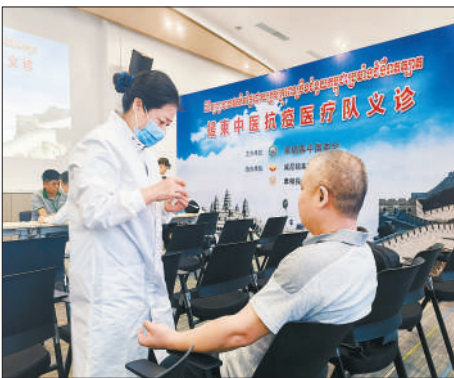
4月8日，柬埔寨中国商会会员单位在柬员工家属接受中国援柬医疗队中医专家针灸治疗。

生的能力。医疗队不仅为柬埔寨新冠病毒感染患者提供了有效的中医药治疗，也在门诊中带去当地医生，培养当地医生认识、了解并能够逐步在临床应用中医药治疗新冠病毒感染患者，对保护柬埔寨民众生命安全有重要意义，更增进了两国人民的友谊。中柬是“铁杆朋友”，共同抗击疫情为两国关系注入了新动力。