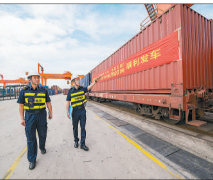
5月16日,浙江省金华市,满载100个标箱中国货物的中亚班列正在经海工作人员监管,准备从中欧班列金东平台——铁路南站鸣笛启程,开往中亚五国。

设施联通是中国同中亚国家最突出的合作成果之一,有力推动了中国同中亚国家构建陆海内外联动、东西双向互济的开放新格局。中亚国家深处欧亚大陆腹地,各类矿产资源 and 油气资源丰富,拥有商品进出口通道对其至关重要。此前,“不靠海、不沿边”的中亚国家只能“望洋兴叹”。2013年9月7日,在中哈两国元首的见证下,连云港与哈萨克斯坦国家铁路公司签署共建跨境货物运输通道及货物中转分拨基地的合作协议,明确将连云港打造成为哈萨克斯坦的战略出海口。2014年5月19日,习近平主席与时任哈萨克斯坦总统纳扎尔巴耶夫在上海通过远程视频,共同见证中哈(连云港)物流合作基地项目投入运营,串联起一条新亚欧陆桥联运通道。得益于此,中亚国家不但获得直通太平洋的“出海口”,更成为连接亚洲和欧洲的重要交通枢纽。截至今年3月底,中哈连云港物流合作基地已累计到发中欧班列5000列,完成运量超44万标箱。班列线路从中亚五国逐