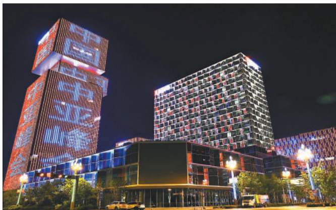
5月15日,中国西安,一处楼群亮灯迎接“中国-中亚峰会”召开。