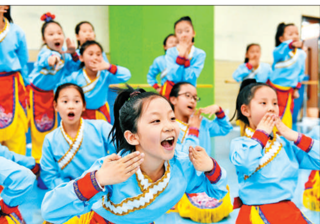
5月23日，山东省济南市历城二中闻韶艺术馆，同学们在练习舞蹈。该校通过开展国乐、舞蹈、合唱等项目，培养学生的兴趣特长和审美情趣，陶冶学生情操，提升学生的艺术修养。