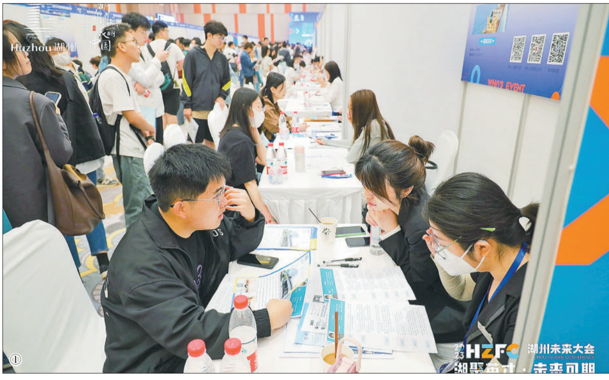
①5月20日,浙江湖州,万人招聘大会现场。

2023年,我国高校毕业生将达到1158万人,同比增加82万人。招工难、就业难并存的结构性矛盾依然突出。人力资源和社会保障部会同教育部、共青团中央、全国工商联日前印发通知,5月29日至6月4日在全国范围内同步启动“就业扬帆 政策护航”高校毕业生等青年就业创业政策宣传周活动。与此同时,地方人社部门发布各种政策,高校、企业等也纷纷采取有效措施吸才、引才,为助力高校毕业生实现充分、高质量就业出实招真招。