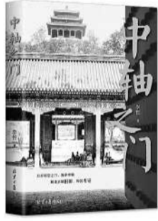
《中轴之门》书封 北京日报出版社供图