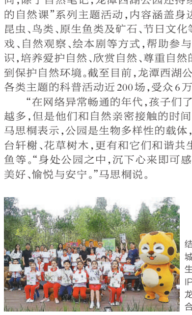
“自然笔记”课后,北京市东城区板厂小学的学生们与中国青年报IP形象青小豹在龙潭西湖活动现场合影。