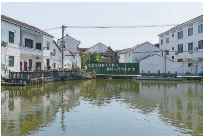
6月9日，浙江金华武义县白洋街道，后陈村街头的标语写着“发展全过程人民民主 保障人民当家做主”。这里诞生了全国第一个村务监督委员会，对农村基层治理民主的有益探索形成了在全国推广的“后陈经验”。