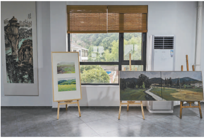
6月7日，浙江绍兴越城区鉴湖街道塘村，云松乡村艺术馆内。绍兴市“行走乡村 文化润乡”优秀美术作品展正在这里举行，馆内可以看到当地书画、陶艺等艺术家以本地风土人情为主题创作的各类作品。