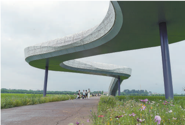
6月8日，浙江东阳卢村共享田园里，一座七彩廊桥跨越无人化生产的智慧农田和花丛。上世纪90年代，“农技+农机+社会化规模服务”的“棠棣经验”曾闻名全国。2019年，卢村依托物联网技术搭建智慧云平台，将农田纳入5G数字化管理，新时代的“棠棣经验”让农业变得更高效、更智慧。