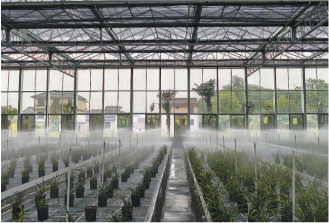
6月8日，浙江绍兴柯桥区漓渚镇棠棣村兰花数字工厂，数字化系统在智慧大棚内实施喷淋浇水，窗外是村里的民居。棠棣村已成为以花木交易为主导产业、以兰文化创意研学体验为新兴产业的特色旅游景区村，2022年村民人均可支配收入超过12万元。