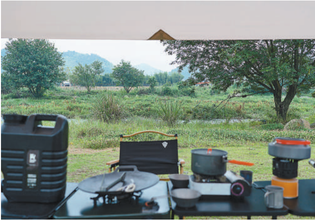
6月5日，浙江湖州安吉县天荒坪镇余村大道边，一处户外帐篷下的露营区。安吉县依托生态优势，在余村布局户外露营、特色民宿、共创空间、青年人才社区等新业态、新模式。