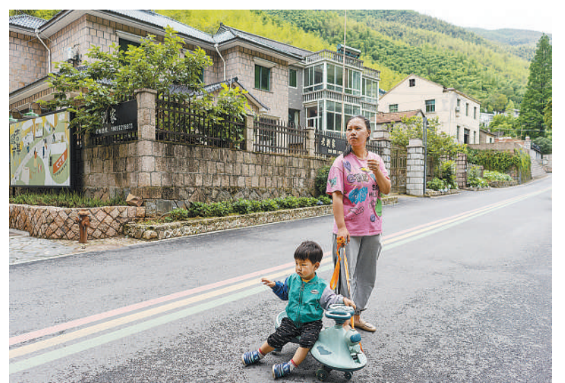
6月6日，浙江湖州德清县莫干山镇仙潭村，一名年轻村民带着孩子外出散步，这条路沿线的人家都经营着民宿，她家也不例外。当地在5个村子布局打造作家村、编剧村、综合艺术村，实施“驻村绿卡”计划，吸引艺术家驻村创作。今年一季度，莫干山民宿吸引游客超20万人次，全镇游客量达到70万人次，旅游综合收入6.5亿元。