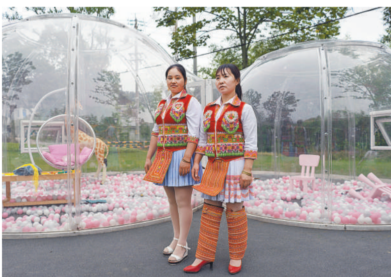
6月5日，浙江湖州安吉县天荒坪镇银坑村，两位来自云南广南的手工艺者在网拍装置旁拍摄短视频，宣传苗族特色服装制作工艺。她们来浙江务工已有近20年，这里的纺织业为她们提供了就业机会。