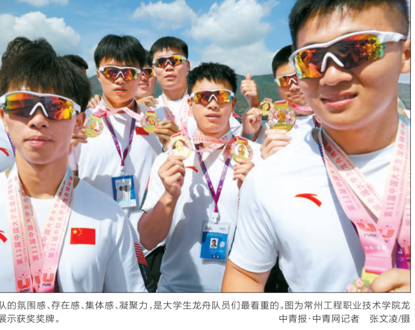
团队的氛围感、存在感、集体感、凝聚力,是大学生龙舟队员们最看重的。图为常州工程职业技术学院龙舟队员展示获奖奖牌。

感、凝聚力,是每个龙舟队员最看重的。德州职业技术学院女子龙舟队队员,全部是学前教育专业的学生。这些经常在室内唱歌、跳舞、弹钢琴的姑娘们,先要在10多天里学会游泳,然后在户外顶着暴晒学习划龙舟。她们每个人的皮肤都晒得黝黑,散发出健康的光泽。