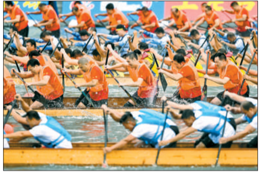
在今年的广州国际龙舟邀请赛上,传统龙、彩龙和游龙的队伍均来自广州本地,汇聚了广州市龙舟赛事的佼佼者。图为传统龙组别比赛现场。