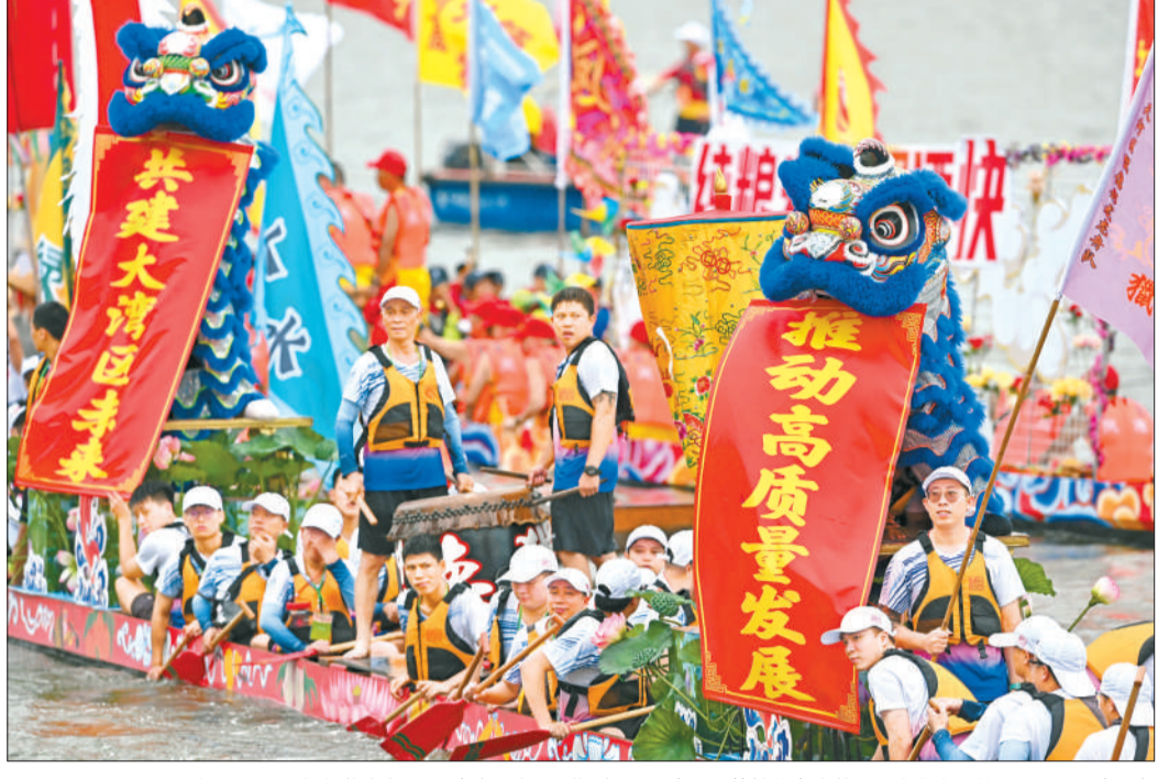
6月17日,2023年广州国际龙舟邀请赛开幕,来自广东、香港、澳门、马来西亚等地的海内外125支龙舟队的近5000名选手在珠江上逐浪竞速,图为比赛中的彩龙竞渡和游龙表演。

去年北京冬奥会二十四节气宣传片中,具有岭南特色的“龙头”带着水花跃出水面。这件作