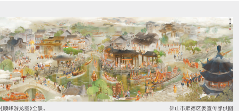
《顺峰游龙图》全景。