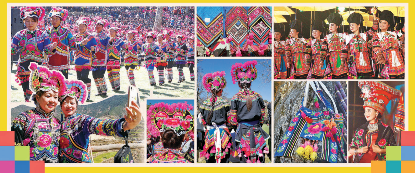
云南楚雄彝族自治州大山里的女子，用一根小小的绣花针，绣出了一个让世界惊艳的亿元大产业。