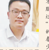
团广西壮族自治区贺州市昭平县委书记 唐明哲