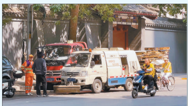
6月23日，北京，环卫工人正在清扫车旁作业。