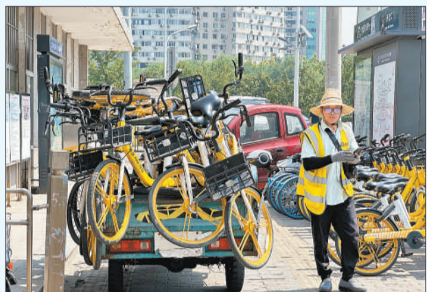
6月23日，北京，地铁站外，清运员正在转运共享单车。