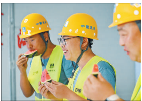
6月16日，在天津市滨海新区耀华中学滨海学校项目工地，一线工人在吃公司送来的西瓜消暑。

这些户外工作者中，有燃气、电力、建筑行业工人，有快递员、外卖骑手、网约车司机，有环卫工人，有交通警察……极端高温下，他们仍坚守岗位。因此，高温保障措施制度的完善和有效执行对劳动者权益保护至关重要。