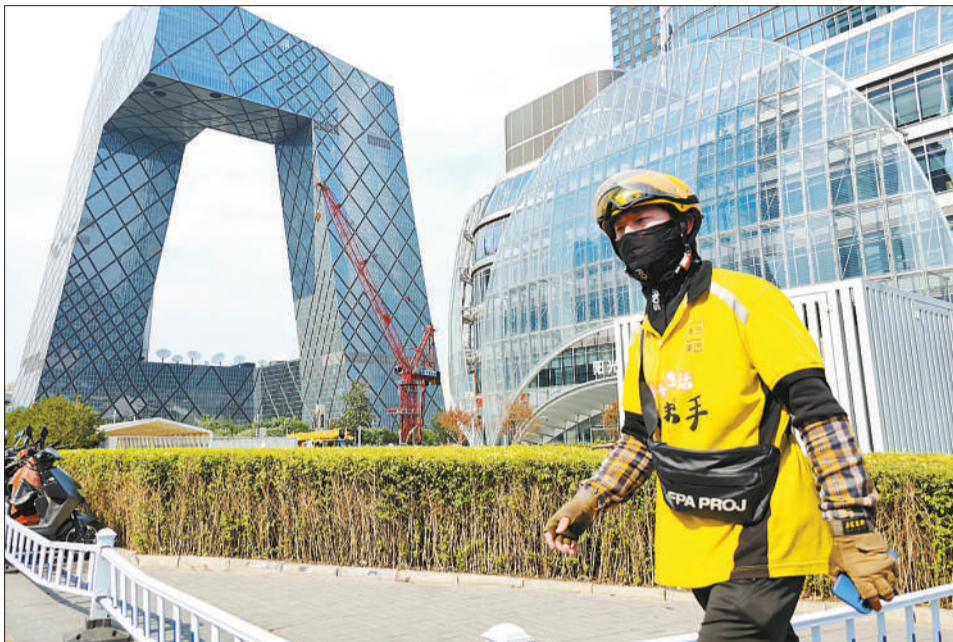
北京市气象台2023年6月23日7时发布高温红色预警。图为一名外卖骑手在北京街头行走。

高温天气持续不断，户外劳动者能否及时享受到高温津贴？灵活就业人员的高温“清凉权益”又如何维护？对此，中青报·中青网记者进行了采访。