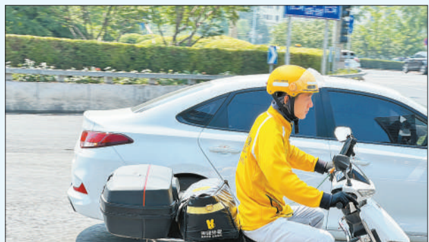
6月23日，北京。一外卖员在配送货品。