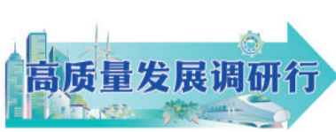
中青报·中青网记者 朱彩云 田宏炜