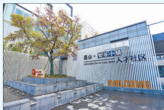
昆山·智谷小镇高品质人才社区