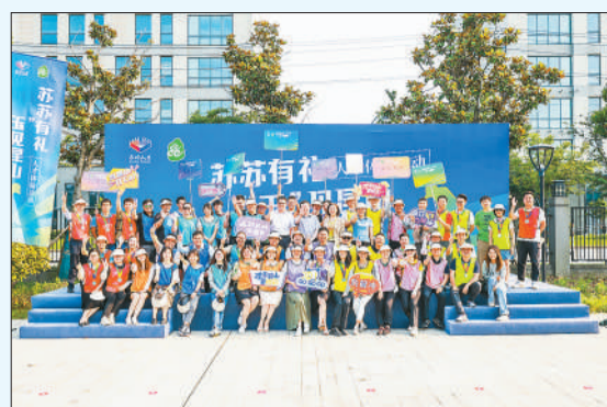
“玉”见昆山人才体验活动