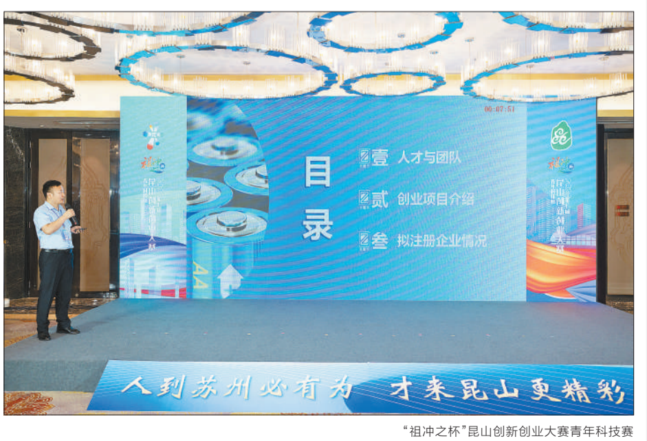
“祖冲之杯”昆山创新创业大赛青年科技赛

千秋基业，人才为先。昆山始终坚持人才优先发展、人才引领驱动的战略定力，以“产、城、人”融合发展的工作理念，全面创优人才环境“生态圈”。接下来，昆山将紧盯重点国家、重点区域、重点领域，通过重点活动加快集聚各领域各层次创新创业人才，全方位拓宽人才招引渠道，调动好海外高端人才、知名乡贤等群体积极性，注重发挥好专业创投机构、民间资本慧眼识才能力，建立人才活动矩阵，形成引才发展胜势。在这片创新因子活跃、人才汇聚一堂的热土上，人才与科创相辅相成的美好画卷正在徐徐展开。