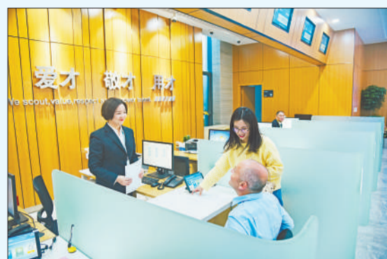
高层次人才“一站式”服务