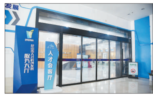
昆如意人才会客厅