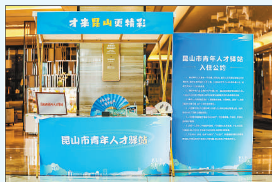
昆山市青年人才驿站