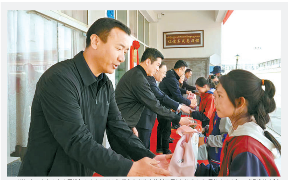
浙江省嘉兴市电力志愿服务中心在四川省阿坝藏族羌族自治州开展“嘉手牵手 民族心连心”——“深望革命”藏族寄宿制青少年健康生活提升公益活动。

“我们按照《北京市生活垃圾管理条例》和北京大学生活垃圾分类工作领导小组的要求，完善基础设施设备投入，开展垃圾分类各项宣传活动。”该负责人介绍，目前报名的师生志愿者超过200名，并建立了垃圾分类志愿者交流群。每天定时由师生志愿者进行宣传、督导垃圾分类，持续推进全校学生宿舍垃圾分类工作，提高学校生活垃圾减量化、资源化、无害化水平。