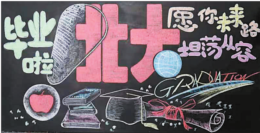
北京大学应届毕业生设计制作的宿舍板报。

长乐区顶层谋划，强化思想领航，植根本区1400多年的历史 and “海滨邹鲁”的人文底蕴，深入挖掘海丝文化、侨乡文化、红色文化、董奉杏林文化等丰富内涵，讲好用好历史故事、红色故事与爱国故事，为青年厚植家国情怀、涵养进取品格提供深厚的