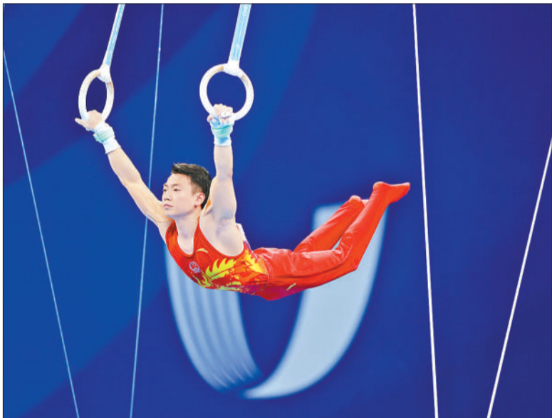
8月2日，四川成都，成都大运会体操男子团体决赛上，邹敬园在吊环比赛中。当日，由邹敬园、侍聪、苏炜德、兰星宇、张博恒组成的中国队在体操男子团体决赛中夺冠，将成都大运会体操项目首枚金牌收入囊中。