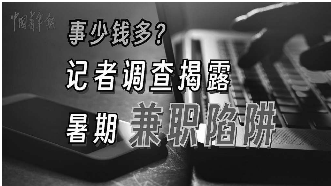
本版制图:吴欣宇 谭思静