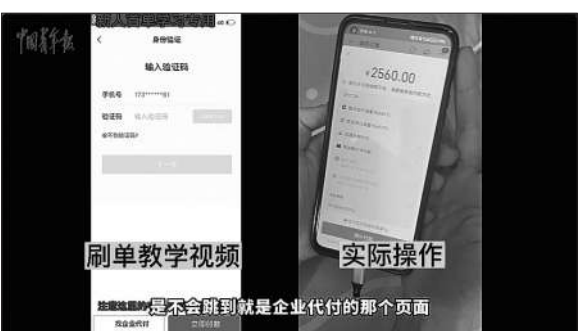
记者调查“刷单”兼职，按照“客服”提供的教学视频操作，到最后支付环节没有跳转至视频中所提到的“企业代付”页面，而是直接进入个人支付页面。

青报·中青网记者采访时表示，在此类兼职陷阱中，大学生虽然只充当了“传话筒”或“信鸽”的中介作用，但是一旦有人上当受骗，情节严重的，参与其中的大学生便可构成帮助信息网络犯罪活动罪（以下简称“帮信罪”）。