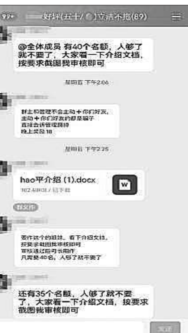
骗子在兼职群内发布“实时兼职剩余名额”。