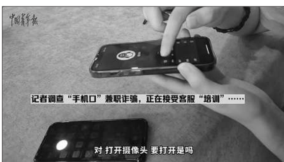
记者调查“手机口”兼职，正在通过QQ语音接受“客服”的“培训”，“客服”要求打开摄像头对准另一台手机以实时监控记者的操作。