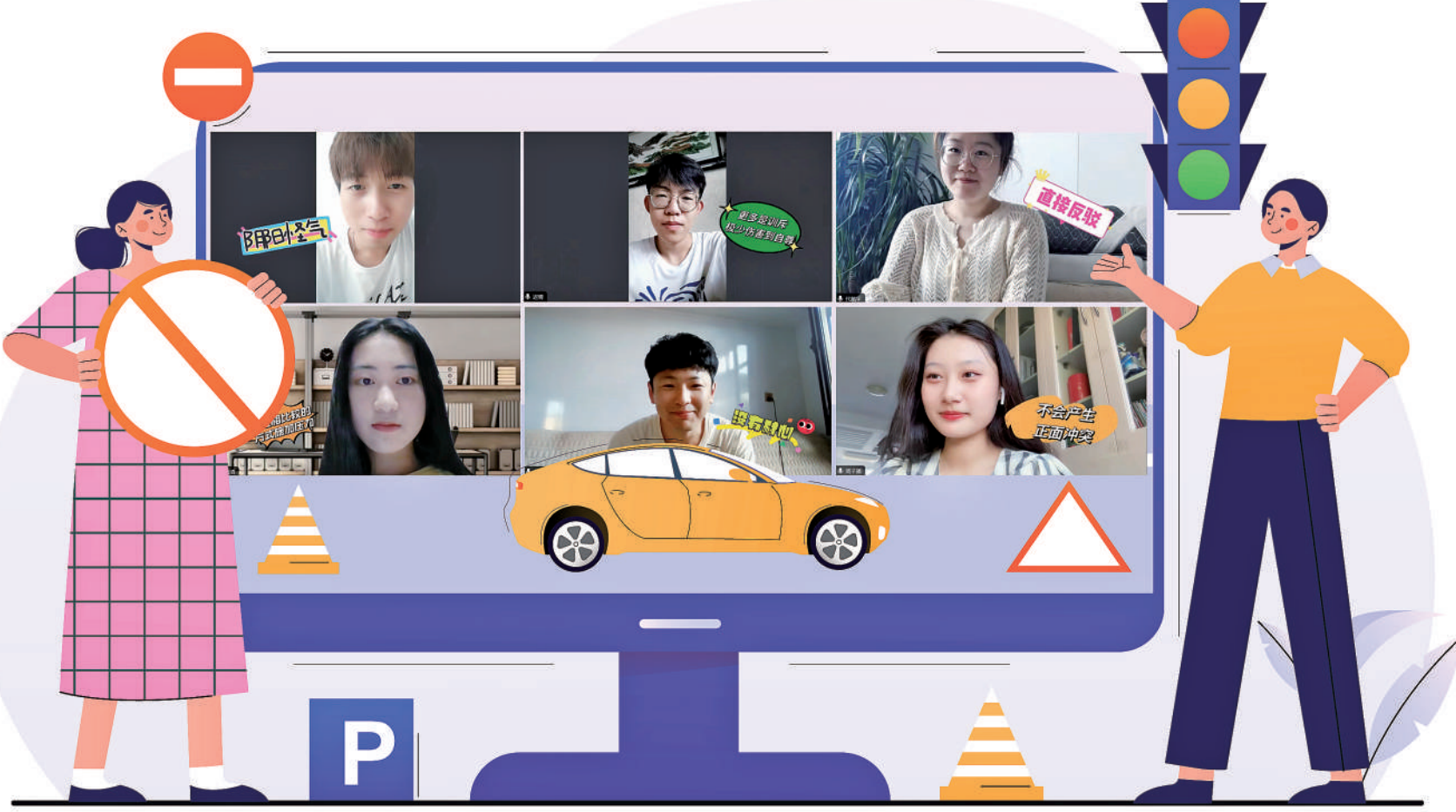
一些大学生接受中青报·中青网记者视频采访,回想起驾校教练的“毒舌”,许多人心有余悸。