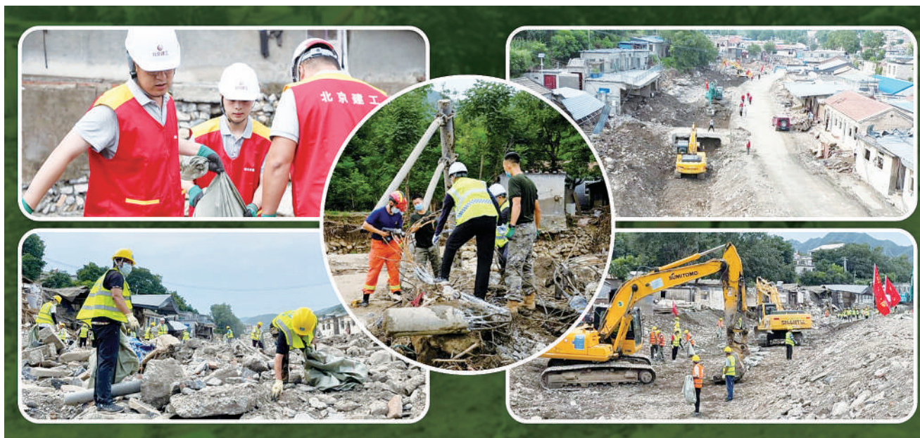
8月底,8支青年突击队的400人接力奋战,对位于北京市门头沟区潭柘寺镇南辛房村内的一条泄洪沟渠进行清淤,为后续的重建做好基础性工作。

当时,水务部门的负责人愣了一下,短暂的迟疑后点了点头,迟疑可能是觉得,那么硬的骨头,这几个年轻人能啃得动吗?点头可能是觉得,共青团能组织动员起更