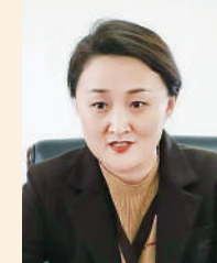
团黑龙江省委大连市委书记 马金莹

团五大连池市委以县域共青团改革为契机,依托“一专一站两联”广泛联系团员青年,充分发挥桥梁纽带作用,积极投身乡村振兴主战场、服务基层最前沿,推动服务青年工作在乡村基层取得新成效;以“党建带团建 团建促党建”为引领,积极选树“村村都有好青年”典型,为农村基层团组织培养储备青年骨干;以乡镇、街道团组织为依托,选派社区、村团员青年入驻基层网格,为基层治理注入青春动能;以乡镇街道“青年之家”为阵地,打造“情暖连池”青年交友实践活动品牌;以“服务乡村振兴争做青年先锋”为载体,组建青年突击队103支,积极开展农村人居环境整治、倡导乡风文明、爱绿护绿等志愿服务活动。团五大连池市委将继续提升服务基层质效,搭建农村青年成长成才平台,团结引领广大团员青年为乡村振兴贡献青春力量。