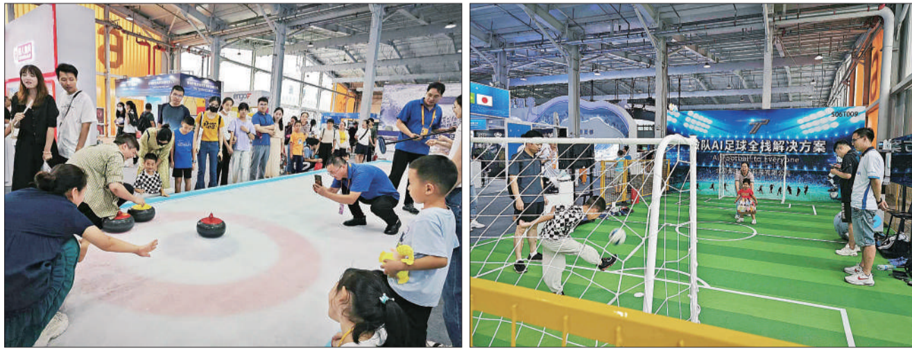
左图：9月2日，2023年中国国际服务贸易交易会开幕首日，体育服务专题展展区的冰球体验展位人气颇高。右图：9月2日，2023年中国国际服务贸易交易会开幕首日，两个小朋友在体育服务专题展展区踢球，右侧为相关展位工作人员与球感知系统装置。

基础设施逐渐完善，有越来越多的体育赛事在不同的城市举办，很多国际赛事也逐渐回归中国。”在服贸会期间举行的体育专题论坛上，英国驻华贸易副使节施睿睿列举了中英在体育产业合作方面具备的基础条件。他说，随着中国户外运动设施越来越多，户外运动人口越来越多，人们越来越注重健康，希望能亲近自然，“中英可以在很多领域开展合作，包括提供户外项目的教练服务、培训服务等。”