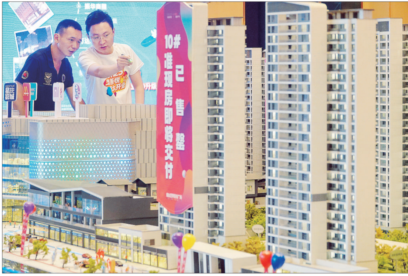
8月25日，山东烟台，市民在售楼处观看房产项目沙盘模型。

近期一揽子政策发力，促进楼市企稳回暖。对此，专家认为，“政策扶持改善需求的目的明显。”支持改善型需求，推动“卖一买一”，能带动首套房购置的刚需，从而让商品房循环链条加速。