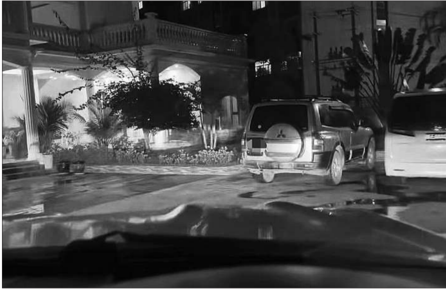
某诈骗公司的人头费价目表。