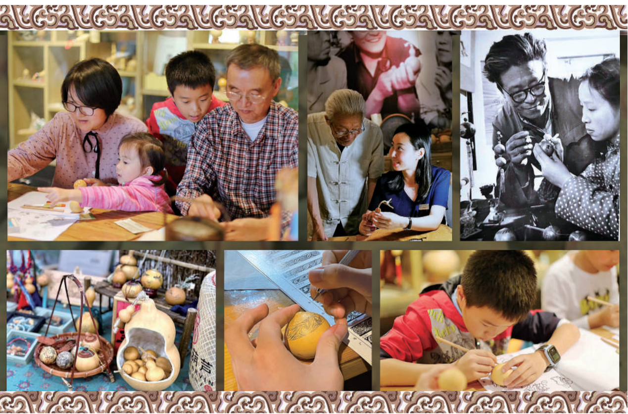
四代传承，兰州刻葫芦阮氏葫芦吸引更多体验非遗技艺。