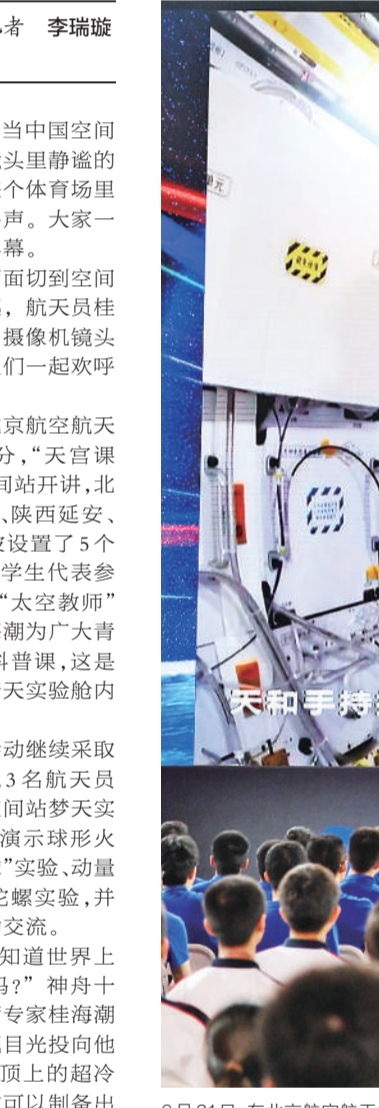
9月21日，在北京航空航天大学，学生收看“天宫课堂”第四课。天宫课堂第四课由神舟十六号航天员景海鹏、朱杨柱、桂海潮进行授课。

9月21日下午，当中国空间站天和全景摄像机镜头里静谧的太空画面出现时，整个体育场里回荡起学生们的欢呼声。大家一起挺直身子望着大屏幕。 第二声惊呼在画面切换到空间站梦天舱内部时响起，航天员桂海潮朝着舱内的定向摄像机镜头飘过来，现场的学生们一起欢呼起来。 这一幕发生在北京航空航天大学。当天15时48分，“天宫课堂”第四课在中国空间站开讲，北京、内蒙古阿拉善盟、陕西延安、安徽桐城及浙江宁波设置了5个地面课堂，约2800名学生代表参加了现场活动。新晋“太空教师”景海鹏、朱杨柱、桂海潮为广大青少年带来一场太空科普课，这是中国航天员首次在梦天实验舱内进行授课。 本次太空授课活动继续采取天地互动方式进行。3名航天员在轨展示介绍中国空间站梦天实验舱工作生活场景，演示球形火焰实验、奇妙“乒乓球”实验、动量守恒实验以及又见陀螺实验，并与地面课堂进行互动交流。 “同学们，你们知道世界上最冷的地方在哪里吗？”神舟十六号航天员乘组载荷专家桂海潮抬起手，示意大家把目光投向他头顶上，“就是我头顶上的超冷原子物理实验柜。它可以制备出地面无法实现的、接近绝对零度的超低温物质，呈现出肉眼可见的宏观量子现象，可以帮助我们更好地探索量子力学”。 从“流体物理实验柜”到“在线维修装调实验柜”……这是“天宫课堂”第四课的第一个环节，“太空教师”带领大家“云参观”梦天舱，一一展示介绍梦天实验舱的基本情况以及舱内相关设施设备。 镜头往前移动，桂海潮来到燃烧室。今年2月，中国空间站进行了首次在轨燃烧点火实验，桂海潮介绍：“就是在我身旁的燃烧科学实验柜里进行的。这个柜子集成了燃料的供给、点火燃烧、图像测量、废气处理等全套的自动化流程。” 一名来自北京的同学问：“微重力环境的燃烧和地面有什么不同？” “这个问题问得非常好。”桂海潮与地面进行科学小互动。（下转2版）