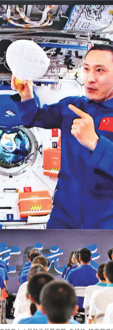
9月21日，在北京航空航天大学，学生收看“天宫课堂”第四课。天宫课堂第四课由神舟十六号航天员景海鹏、朱杨柱、桂海潮进行授课。