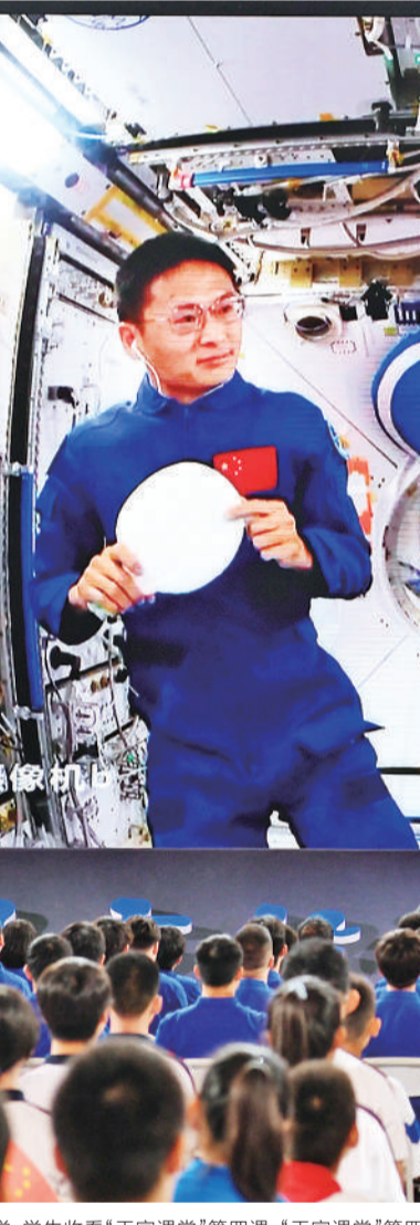
9月21日，在北京航空航天大学，学生收看“天宫课堂”第四课。天宫课堂第四课由神舟十六号航天员景海鹏、朱杨柱、桂海潮进行授课。