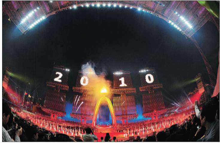
2010年11月12日，广州，第十六届亚运会开幕式在海心沙岛隆重举行，图为火炬点火仪式。