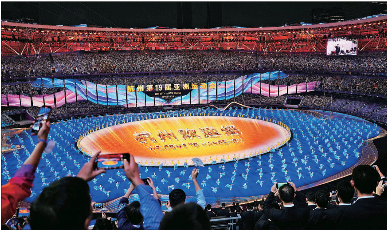
9月23日，杭州亚运会开幕式，观众席数控装置流动点亮，在地屏勾勒出“杭州欢迎您”(WELCOME TO HANGZHOU)巨幅字样。

33年前，当沈坚强成为北京亚运会最佳运动员时，那是他不曾奢望过的荣誉。沈坚强说，“那个时候，对于中国很多项目的运动员、运动员来说，能够在亚洲争夺名次已经是一个很高的竞技梦想。”尽管在北京亚运会上成为“多金王”，并最终成为最佳运动员，但是沈坚强在奥运会的最好名次只是第九名，对于他那一辈的中国男子游泳运动员来说，“冲出亚洲、走向世界”还在路上。但33年后，亚运会对于中国很多项目的运动员、运动员来说，仅仅是一个以赛代练的平台。张雨霏可以大胆地喊出争