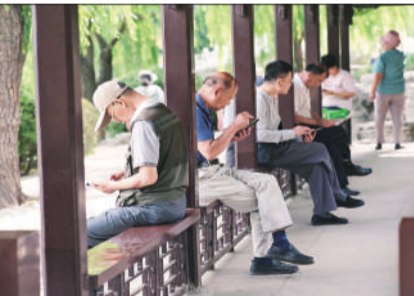
6月12日,北京,紫竹院公园,坐在走廊里看手机的老年人。