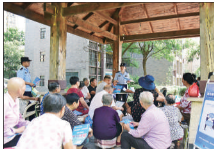
8月16日,安徽省马鞍山市,当涂县年轮派出所民警走进小区向老年群体宣传防范养老诈骗知识。