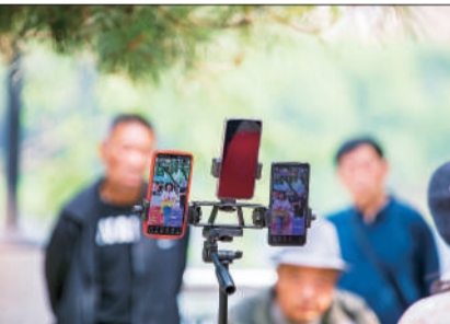
6月13日,吉林,老人在松花江畔唱二人转用手机玩直播。