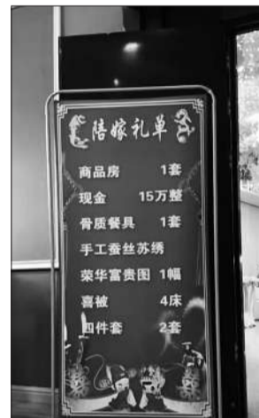
5月20日，陕西省定边县一对新人婚礼现场，宴会入口处摆放着新娘陪嫁财物清单。