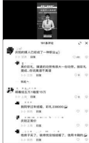
甘肃省庆阳市12345政务服务热线中心的短视频公众号评论区，网友讨论高价彩礼及职业媒人“提成”现象。