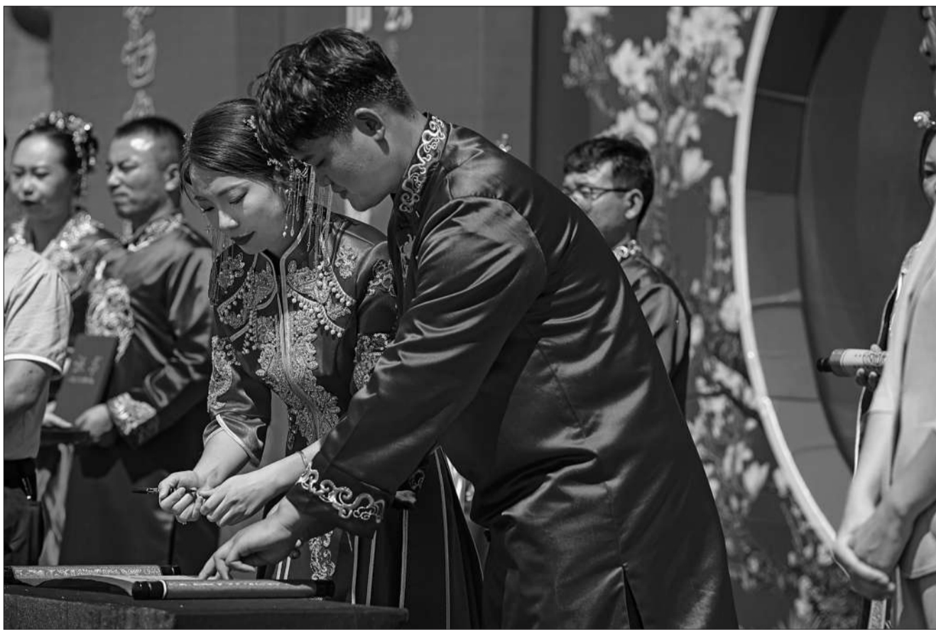
宁夏回族自治区青铜峡市举办“浪漫七夕执手相约，移风易俗青年先行”青年集体婚礼。图为新人在集体婚礼仪式现场签订婚书。

“抵制高价彩礼，青年及其家人的思想工作，共青团都要做。要促进人们的更新观念，让彩礼回归合情合理。”李树荣说，团固原市委正在筹划设立青年婚恋交友工作室，从年龄、职业、性格等方面，为单身适婚男女青年精准做好交友服务，倡导青年婚恋以人品、感情为重，避免婚姻被高价彩礼“绑架”。