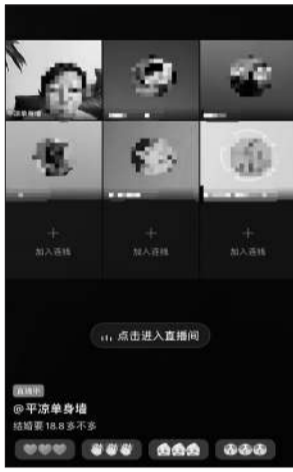
一名自称是甘肃省平凉市某婚恋服务企业的短视频博主，夜晚在直播间发起群聊交友相亲，并将直播问题目设置为与彩礼有关的“结婚要18.8多不多”。