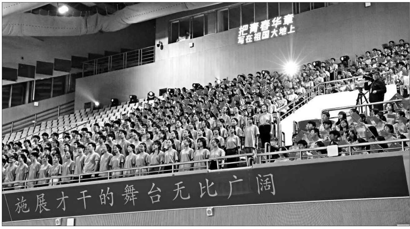
10月14日晚，“把青春华章写在祖国大地上”大思政课网络主题宣传和互动引导活动现场，四川大学学生齐唱校歌。