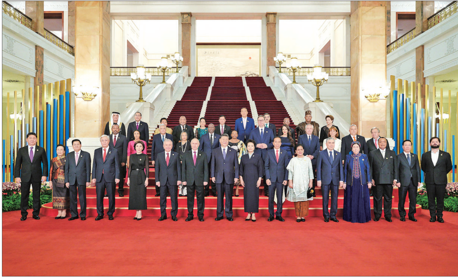
10月17日晚，国家主席习近平和夫人彭丽媛在北京人民大会堂举行宴会，欢迎来华出席第三届“一带一路”国际合作高峰论坛的国际贵宾。这是习近平和彭丽媛同国际贵宾合影留念。

新华社北京10月17日电（记者杨依军 孔祥鑫）10月17日晚，国家主席习近平和夫人彭丽媛在人民大会堂举行宴会，欢迎来华出席第三届“一带一路”国际合作高峰论坛的国际贵宾。李强、赵乐际、王沪宁、蔡奇、丁薛祥、李希、韩正出席。 秋日北京，夕阳入画，天安门广场华灯绽放，人民大会堂庄严辉煌。 出席高峰论坛的外国国家元首、政府首脑、国际组织负责人等国际贵宾及配偶陆续抵达人民大会堂。礼兵列队致敬。150多面共建“一带一路”国家国旗和联合国旗，整齐分列红毯两侧，