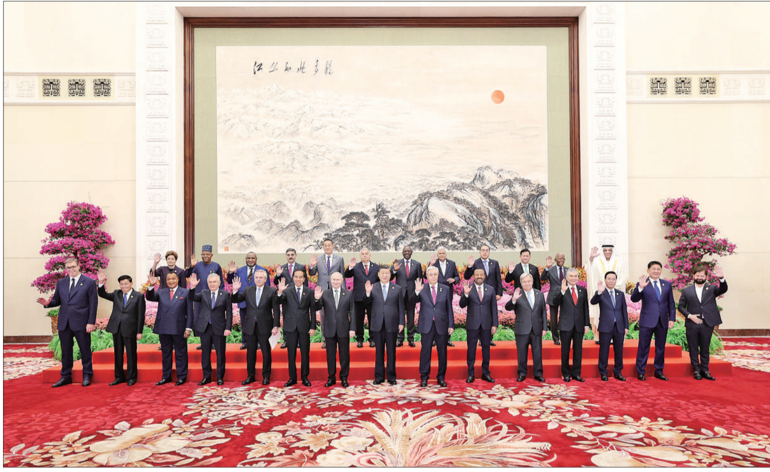
10月18日上午，国家主席习近平在北京人民大会堂出席第三届“一带一路”国际合作高峰论坛开幕式并发表题为《建设开放包容、互联互通、共同发展的世界》的主旨演讲。