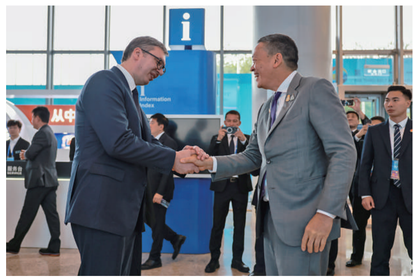
10月18日,北京国家会议中心,塞尔维亚总统武契奇(左)与泰国总理赛塔·他威信握手。