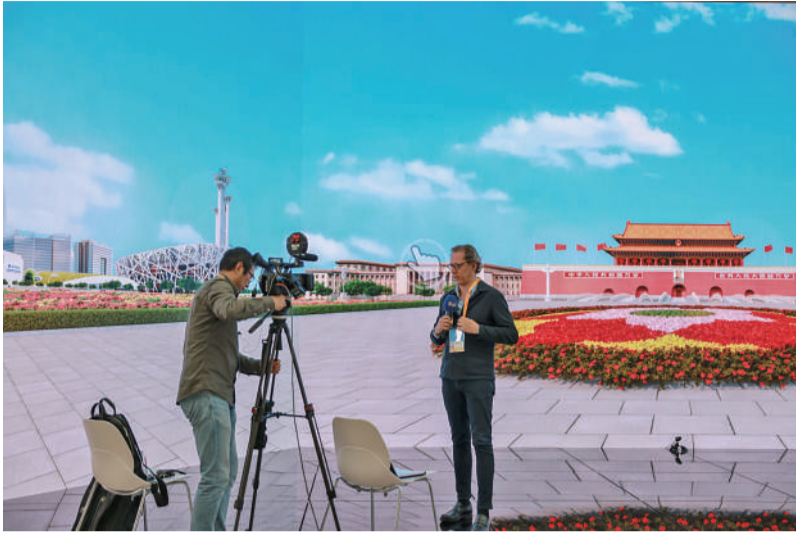
10月16日,北京国家会议中心,第三届“一带一路”国际合作高峰论坛新闻中心,来自意大利的记者在8K超清大屏前播报新闻,大屏中的互动装置展示着北京许多地标性建筑。

10月17日,北京国家会议中心,第三届“一带一路”国际合作高峰论坛企业家大会结束后,参会代表乘坐扶梯离开,不少代表趁着这个机会继续交流。据介绍,包括外国政府官员、国际组织和机构代表、外国商协会和中外知名企业负责人在内的1200余位代表参加了该大会,近300位中外代表现场签署合作协议。