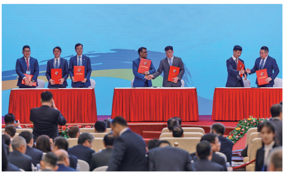
10月17日,北京国家会议中心,第三届“一带一路”国际合作高峰论坛企业家大会现场进行签约仪式。近300位中外代表现场签署合作协议,项目涵盖基础设施、清洁能源、人工智能、生物医药、金融服务、现代农业、轨道交通等多个领域。