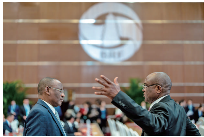
10月17日,北京国家会议中心,第三届“一带一路”国际合作高峰论坛企业家大会开始前,各国代表互相交流。据介绍,参加本次“一带一路”企业家大会的1200余位代表中,中外代表约各占一半。外方代表来自80多个国家和地区,其中包括20多位外方部长级官员、30多家外国商协会负责人和近60家世界500强企业代表。