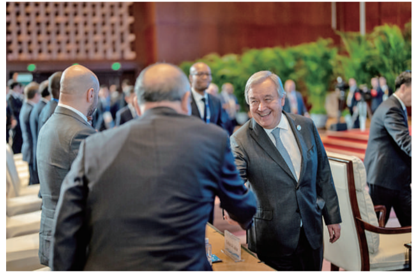
10月18日下午,北京国家会议中心,第三届“一带一路”国际合作高峰论坛绿色发展高级别论坛上,联合国秘书长古特雷斯和中国气候变化事务特使解振华握手。古特雷斯在开幕式致辞中指出,没有基础设施就没有发展,广大发展中国家目前仍有数十亿人缺乏基础设施,这是本届“一带一路”国际合作高峰论坛以及共建“一带一路”倡议的重要性所在。

今年是共建“一带一路”倡议提出十周年。十年来,“一带一路”国际合作从亚欧大陆延伸到非洲和拉美,与世界共享发展的成果和机遇。 10月17日至18日,第三届“一带一路”国际合作高峰论坛在北京举行,3场高级别论坛分别聚焦互联互通、绿色发展和数字经济,6场专题论坛则围绕贸易畅通、民心相通、智库交流、廉洁丝路、地方合作、海洋合作等议题展开交流。在新的历史节点,各国代表齐聚一堂,探讨未来合作的无限可能。