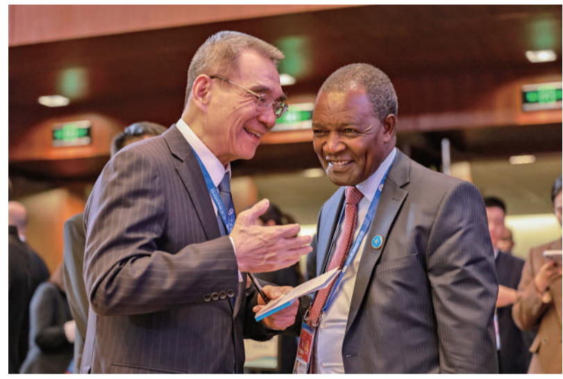
10月18日,北京国家会议中心,第三届“一带一路”国际合作高峰论坛贸易畅通专题论坛开始前,世界银行原副行长、北京大学新结构经济学研究院院长林毅夫(左)与肯尼亚财政和规划部部长恩朱古纳·恩东乌交流。该论坛邀请了数十位“一带一路”共建国家政府官员、专家学者和工商界代表等,聚焦推进高水平贸易畅通,深化多双边经贸合作,提升贸易投资自由化便利化水平等话题。