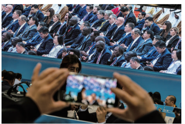
10月18日,北京国家会议中心,第三届“一带一路”国际合作高峰论坛新闻中心内,一名记者通过大屏幕拍摄论坛开幕式。