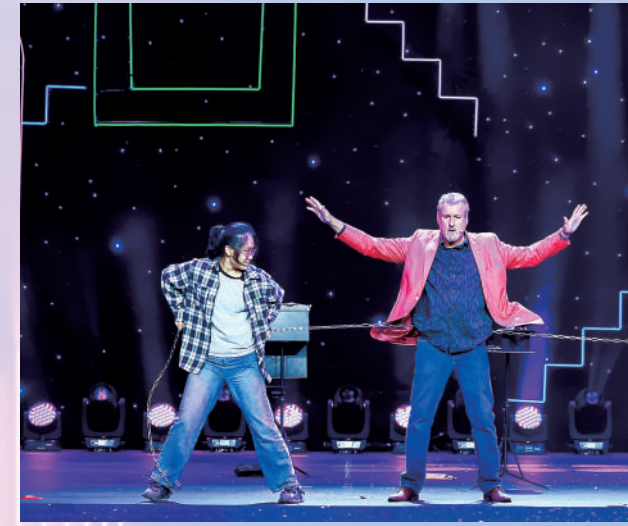
魔术师迈克·米勒表演《迈克尔报》