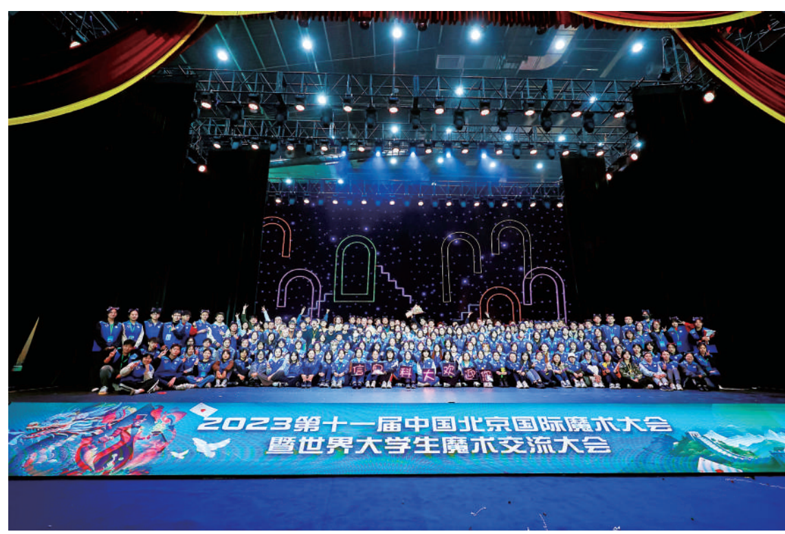
第十一届中国北京国际魔术大会北京信息科技大学志愿者合影