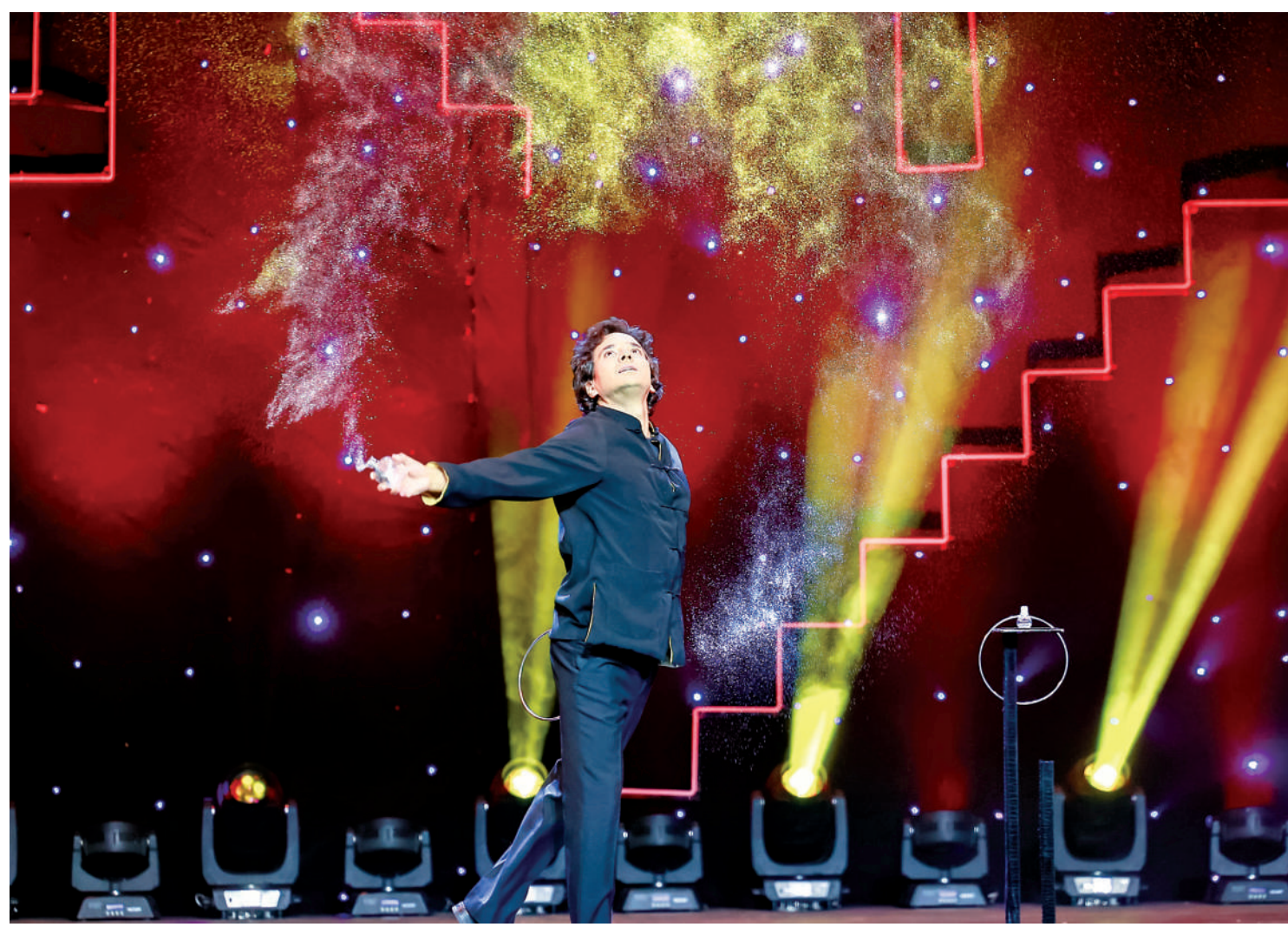
魔术师大卫·索萨表演《幻影》

“学校连续4年位居‘全国普通高校毕业生机器人竞赛指数’排行榜第一。”北京信息科技大学教务处处长朱浩说，除“i宝”外，学校足球机器人“Water1”5次荣获RoboCup机器人世界杯“中型组”比赛世界冠军，学生在智慧养老、无人勘测、智能办公等应用领域的机器人创业项目得到广泛应用和认可。