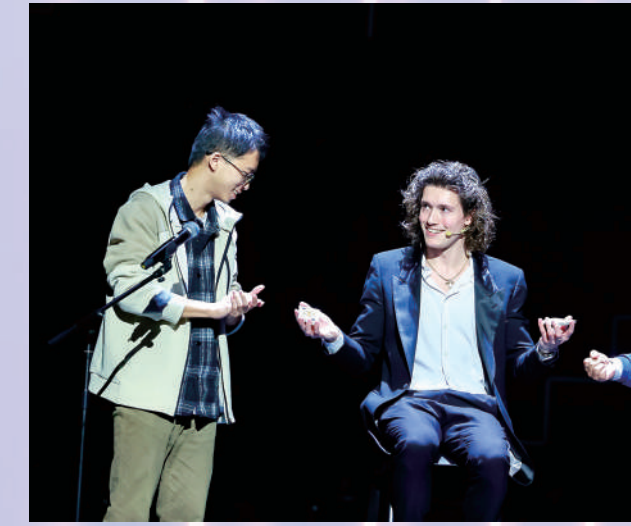
魔术师布鲁斯·塞拉表演《给奇看》