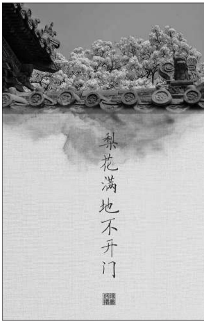
故宫承乾宫的梨花。

“下一步，我想拍摄‘古诗里的中国’，去更多的地方旅行，用镜头还原诗人笔下的大美中国。”今年春天，阳梦舒去婺源旅行，在虹关村拍摄一棵生长在水边的桃花树。拍完往回走时，她突然发现