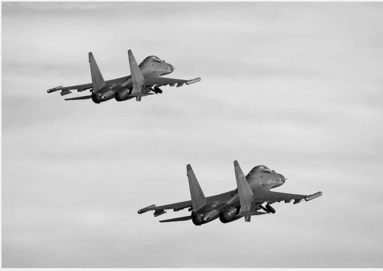
10月15日,南部战区空军航空兵某旅组织实战化飞行训练,锤炼提升部队打赢能力。图为双机起飞。