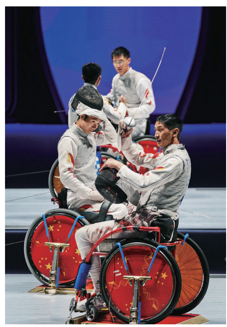
10月25日，浙江杭州，杭州电子科技大学体育馆，杭州亚残运会轮椅击剑男子花剑个人A级半决赛中，4名中国选手同场竞技。